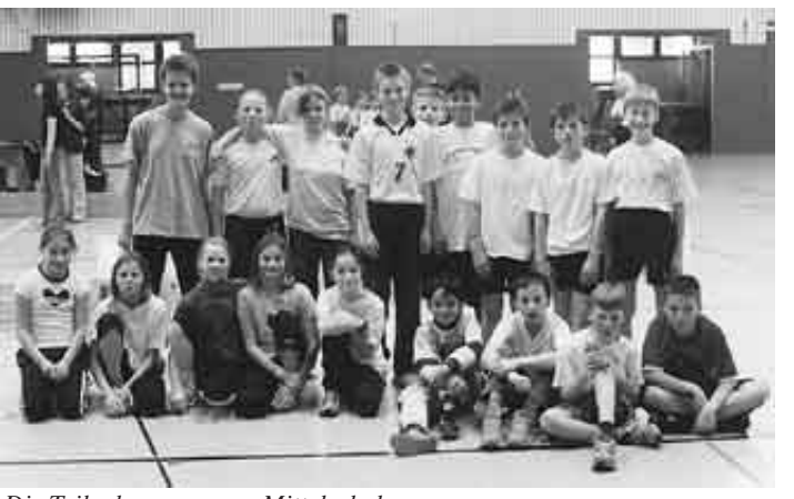
Die Teilnehmer unserer Mittelschule