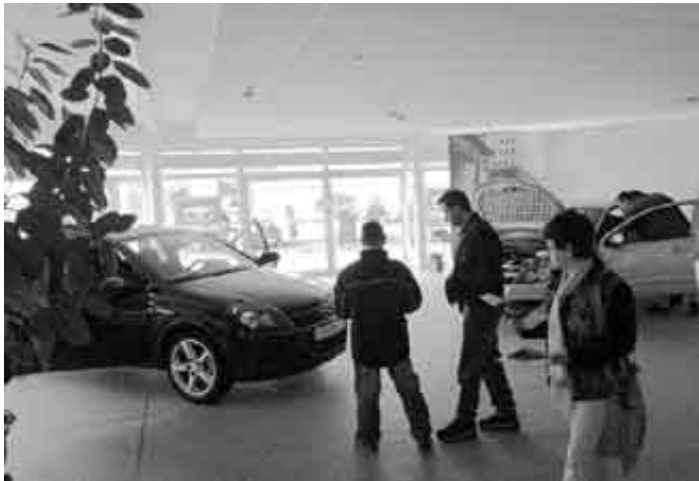
Stieß auf großes Interesse: Der neue Astra, hier im Autohaus Möldgen