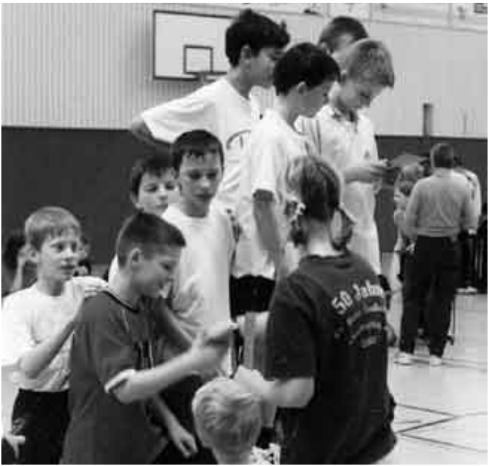
Siegerehrung Staffeln AK 12/13