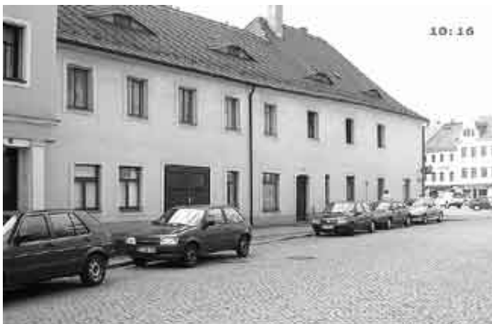
Drei Fahrzeuge standen offenbar den ganzen Tag herum.