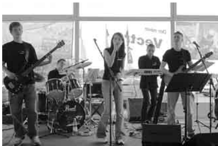
Die junge Radeburger Band „Live Cocktail“ sorgte für die Atmosphäre.