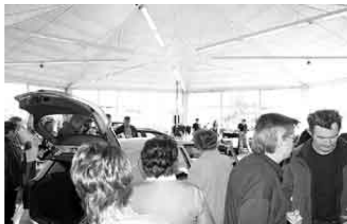
Die Astra-Präsentation wurde im Autohaus Fiebig zu einer „großen Familienfeier“.