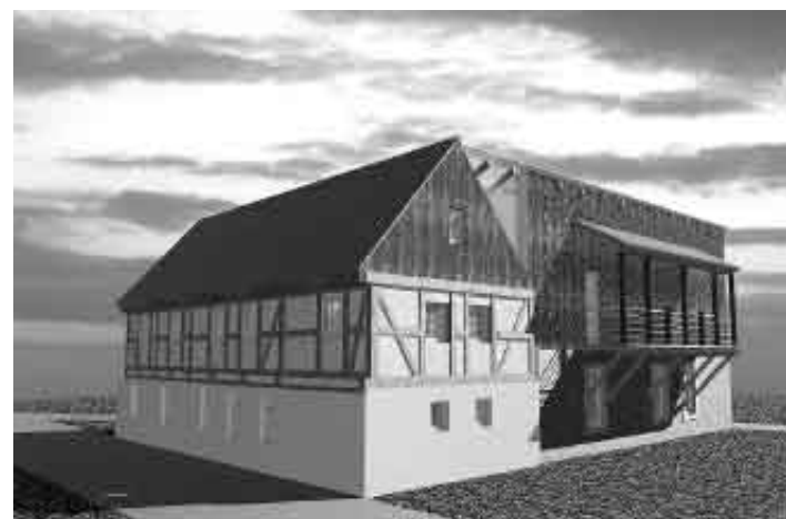
Die zukünftige Ansicht des Gebäudes auf der Röderstraße nach der Sanierung.

Der Gewerbestammtisch trifft sich am 29.11.; 18.30 Uhr im Hirsch zur letzten Absprache: Weihnachtsmarkt