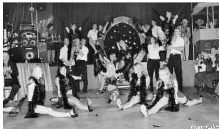
Unsere Gardemädels mit Verstärkung