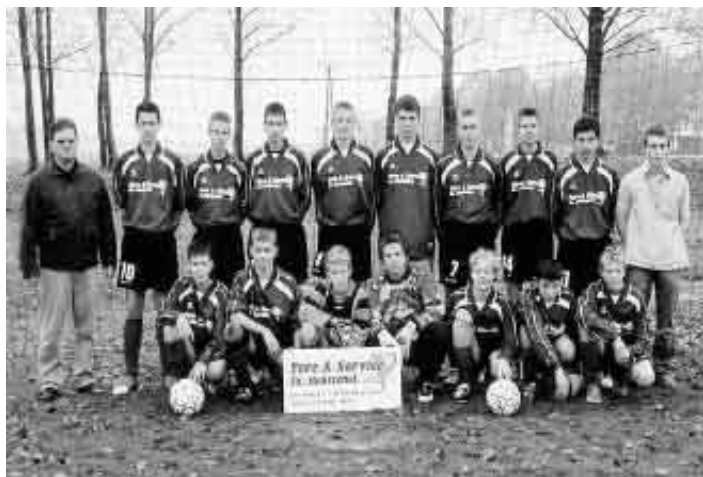
Ein herzliches Dankeschön geht an die Firma Tore & Service Hentschel aus Berbisdorf, die den B-Junioren eine neuen Trikotsatz sponserte.